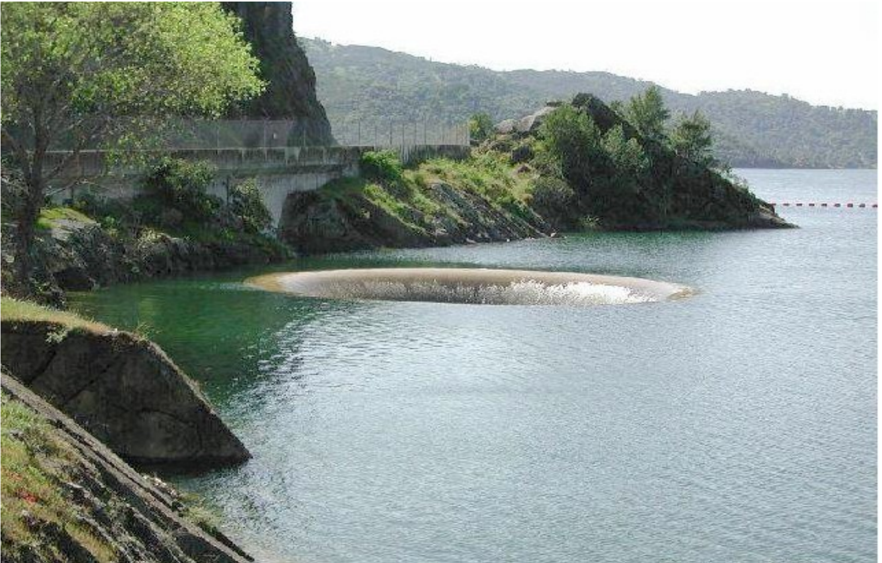
L'entonnoir du barrage de Monticello, en Californie. Il engloutit quelque 5000 mètres cube à la seconde. Sa fonction est d'évacuer l'excès d'eau du barrage.